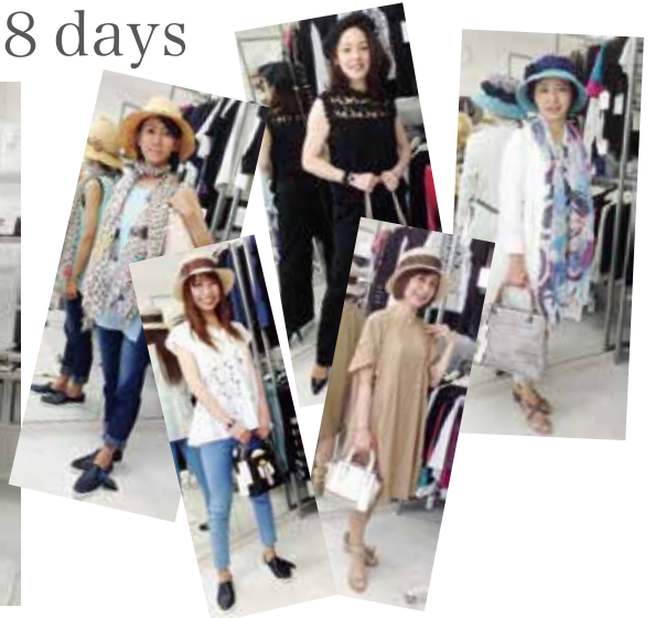
*昨年、春のレッスンに参加された皆さんです。