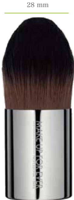
原寸大 80 mm