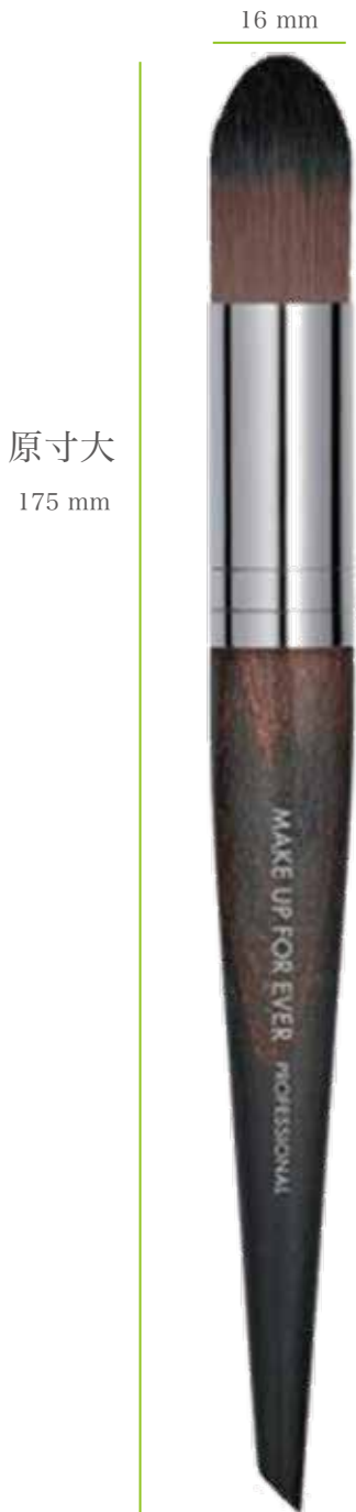
原寸大 175 mm