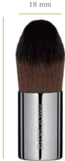
原寸大 60 mm