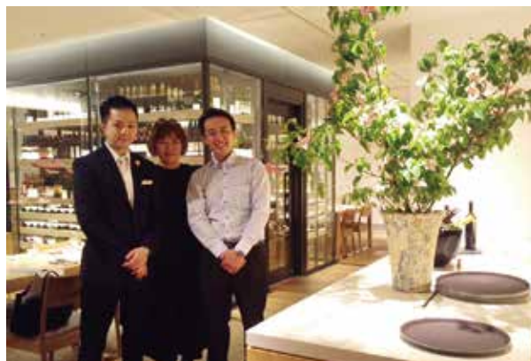
奥田の息子(笑)のようなマネージャーとソムリエのイケメン お二人。中央にワインセラーがあるとっても素敵なレストランです。

京都駅(JR)中央口より 徒歩12分、 五条駅(地下鉄烏丸線)8番出口より 徒歩1分